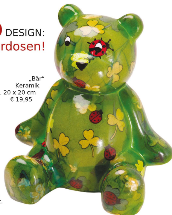
„Bär“ Keramik ca. 20 x 20 cm € 19,95

Die Keramik-Tiere sind teilweise handbemalt oder mit Papier belegt und anschließend gebrannt. An den Standflächen sind Filzunterlagen angebracht.