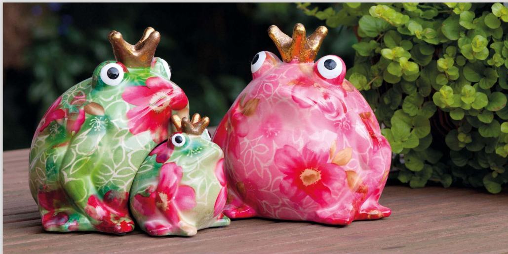
Tierfiguren Keramik, ca. 20 x 27 cm „Frosch & Baby“ € 24,95 „Frosch“ € 19,95